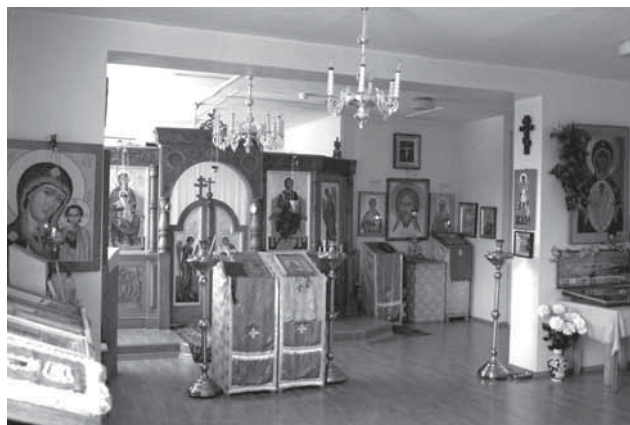
Домовый храм в честь св. прав. Иоанна Кронштадтского