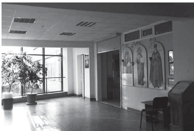
Фойе перед храмом в психоневрологическом интернате № 7

В те времена начальство могло плохо отнестись к подобному начинанию, так что