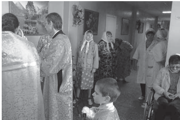
Причащение на отделении

деление интерната (по очереди) и приобщает всех желающих, заранее подготовленных медперсоналом. В итоге за каждой службой причащаются 50–70 человек в храме и 80–120 на отделении.