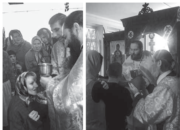
Причащение Святых Христовых Таин в домашней церкви

Часто у пастыря возникает вопрос, как подготовить верующих в интернате к восприятию благодати Божией в Таинстве Святого Причастия. Здесь нужно уметь правильно расположить сердце пациента, дать ему молитвенный, благоговейный настрой. Это происходит, в первую очередь, силою благодати Святого Духа во время совершения Божественной литургии. Перед Святым Причастием в нашем интернате обычно проводится общая исповедь, во время которой через простые, образные, яркие, доступные сердечному восприятию слова достигается покаянное настроение, острое ощущение собственной греховности. В проповеди на общей исповеди раскрываются простые евангельские истины о любви, всепрощении, необходимости молитвы, духовного и телесного труда, о несовместимости благодатной жизни с Богом с греховными привычками и пороками, такими как непослушание медперсоналу, курение, употребление алкоголя и т. д.