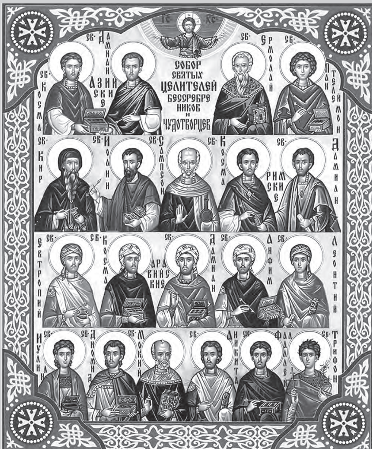
Собор святых целителей, бессребреников и чудотворцев