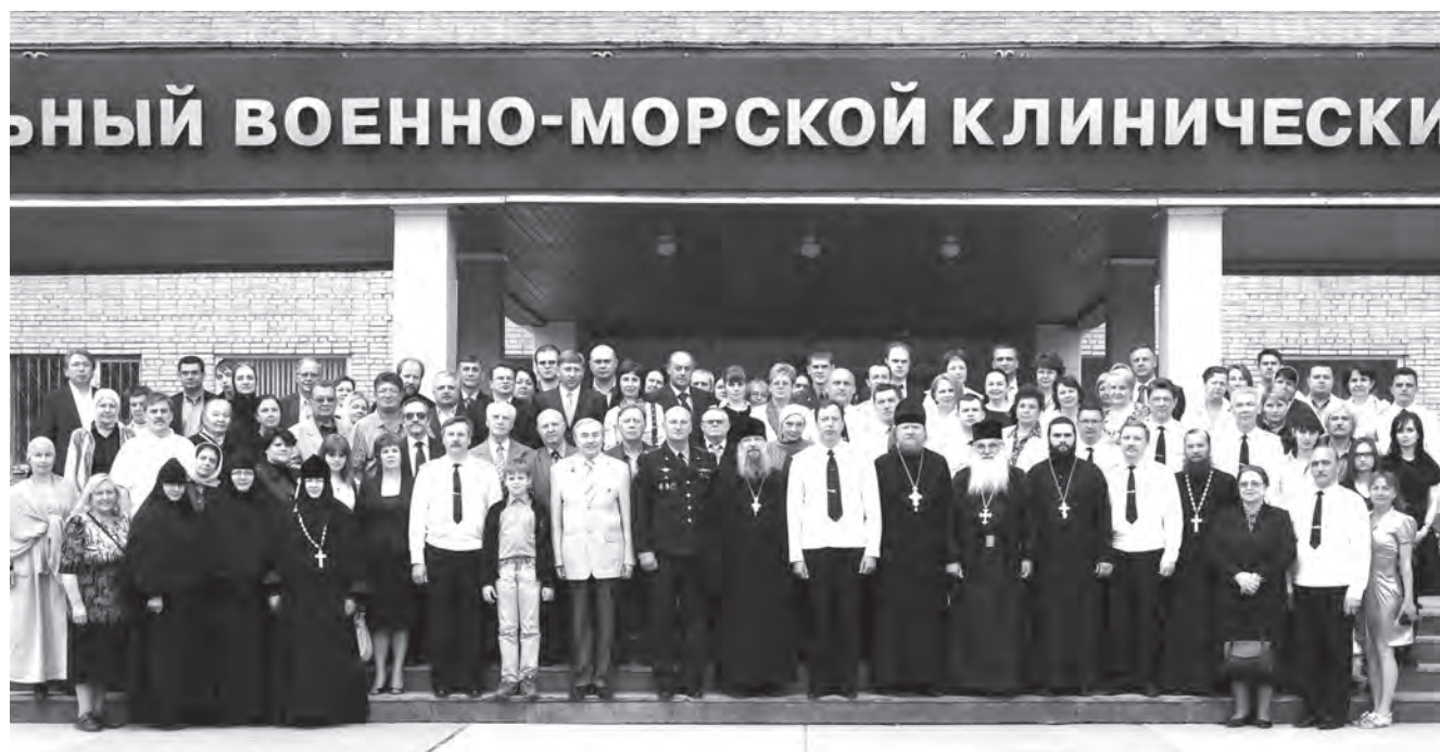
Участники Четвертой международной научно-практической конференции «Духовное и врачебное наследие Святителя Луки (Войно-Ясенецкого)»