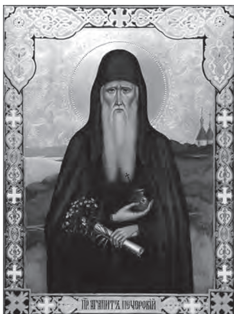
Святой преподобный Агапит

ные Антоний Печерский, Агапит, Алимпий, Лаврентий Печерский. К прославленным врачевателям Киево-Печерской Лавры принадлежал святой преподобный Агапит. Он был учеником святого преподобного Антония Печерского. Врачеватель Агапит безмездно лечил как мирян, так и обитателей монастыря, сам готовил для больных лекарства, учил их применению, а также сам ухаживал за тяжелыми больными. Святой целитель приобрел широкую известность в Киевской Руси. Он исцелил внука Ярослава Мудрого, черниговского князя Владимира Всеволодовича, который впоследствии стал киевским князем и был известен в истории как Владимир Мономах.