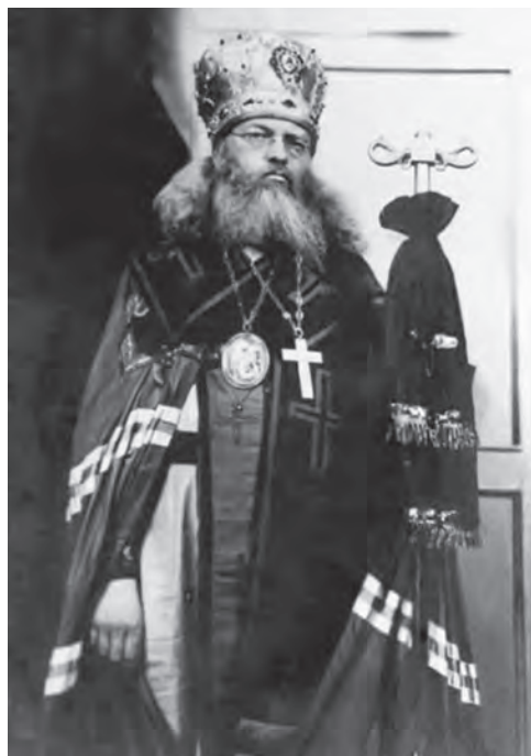
Архиепископ Крымский Лука (Войно-Ясенецкий)

ле под Читой. В этих условиях святитель спасал людей от смерти и успевал делать записи о проведенных операциях. Служение его было поистине самоотверженным: он принимал 100 больных в день, включая ежедневные операции. В период гонений на веру В. Ф. Войно-Ясенецкий стал священником, впоследствии епископом. Он открыто исповедовал веру студентам, коллегам, больным и раненым: читал лекции в рясе, молился перед операцией, йодом помазывал крест над зоной операции у больного, в его предоперационной висела икона.