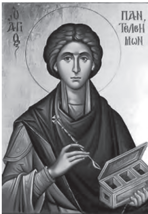
Святой великомученик и целитель Пантелеимон

к деятельности второго придворного врача. Но христианин-наставник и священник Ермолай укрепил Пантелеимона в вере и совершил Таинство Крещения своего ученика. Пантелеимон преуспел во врачебном искусстве, где ему была дарована Богом особая благодать исцелений. Он не стал придворным врачом императора-язычника, а жизнью своей оправдал свое имя Пантелеимон, данное ему в крещении и означающее «всемиловитый». Святой целитель оказывал милость и врачебную помощь всем без исключения и без какого-либо вознаграждения за этот труд. Святой великомученик и целитель Пантелеимон считается небесным покровителем медицинских работников.